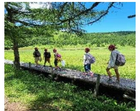
【池の平のハイキング】

39日間の夏休みを有意義に過ごせたことと思います。学校には子ども達の明るい笑顔と元気な声が戻ってきました。感染症第7波拡大で実施が心配される中、5年生が7月23、24日と群馬県の嬭恋高原へ林間学校に行ってきました。6年生の修学旅行と同様に、参加者全員が元気に行って、元気に帰ってくることができました。今回の林間学校のテーマ「みんなで協力し合い、メリハリのある楽しい林間学校にしよう！」でした。普段の学校生活よりさらに適切且つ迅速な集団行動が求められる中、時間をしっかり意識してこの2日間を過ごすことができ、大きな成長を遂げました。そして初めての宿泊学習でしたが、多くの時間を仲間と共有することで5学年の絆がさらに深まりました。