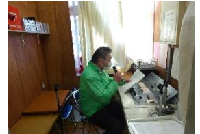
朝霞警察署の方の話

今回は、朝霞警察署の方にも来校していただき、訓練の様子を見た後、子どもたちに向けてのお話がありました。お話の中で、「訓練は大切な命を守るために行っている」「先生の指示や誘導に従ってみんなで協力しながら命を守る行動をとる」